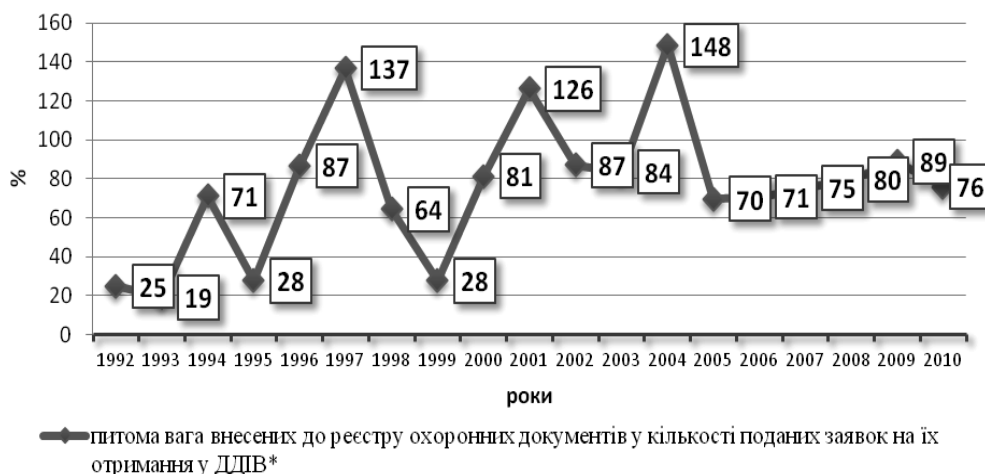
Рис. 3. Динаміка питомої ваги внесених охоронних документів до державних реєстрів у кількості поданих заявок на об'єкти промислової власності, %**

Така ситуація дає змогу фіксувати значний потенціал та готовність вітчизняних підприємств до впровадження прогресив-