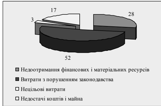
Рис. 3. Питова вага виявлених підрозділами внутрішнього аудиту фінансових порушень у I півріччі 2012 року, %*

Показники діяльності підрозділів внутрішнього аудиту, що проаналізовані вище, свідчать про відповідність фінансових аудитів і аудитів відповідності критерію результативності. Водночас, у звітному періоді з виявлених 111,913 млн. грн. фінансових порушень було відшкодовано 11,191 млн. грн., тобто 10%. Такий рівень відшкодування вважається низьким, проте свідчить про дієвість фінансових аудитів і аудитів відповідності [8].